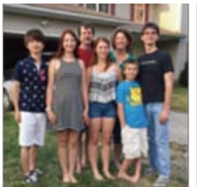
USA(海外研修:フィンドリー大学)