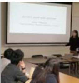
経営学部英会話講習会