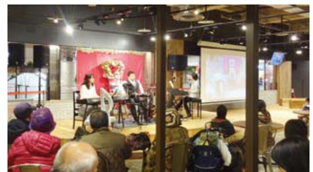
フードコート内のステージではさまざまなイベントが開催されています。