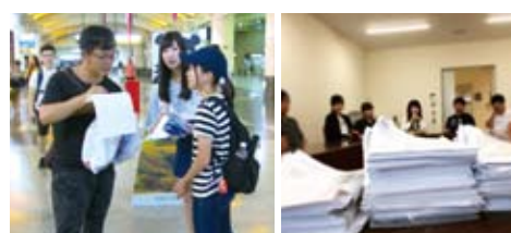
台湾での街頭インタビューと回収されたアンケート用紙