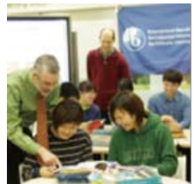
理大グローバル教育センター誕生!