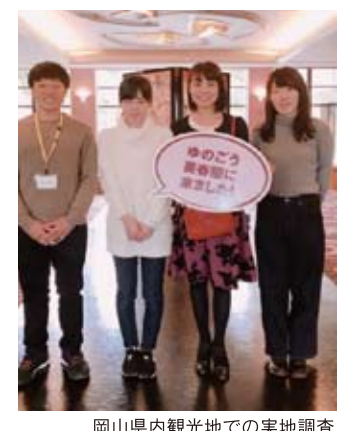
岡山県内観光地での実地調査