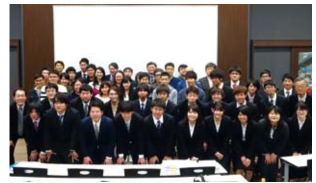
最終発表会を終えて