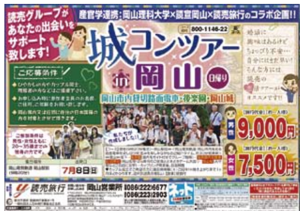
読売旅行より「城コンツアー岡山」商品発売!