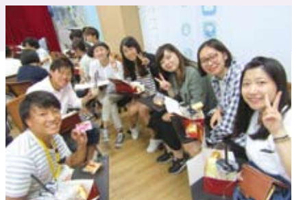
台湾の致理科技大学での交流会

魅力ある旅行プランを作るため、岡山県内の観光地を実地調査。地元の飲食店の方、地方自治体の方々にもご協力いただきながら企画しました。9月には台湾の主要駅での街頭インタビューや岡山理科大学の提携校である致理科技大学の学生にアンケート調査を実施。日本の観光業に携わる現地企業や、タイガーエア台湾での聞き取り調査も行いました。台湾で得た1,300を超えるアンケート結果に基づき最終の旅行プランを企画、プレゼンしました。優秀なプランは読売旅行から発売されました。