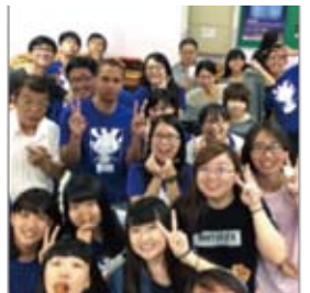
台湾(交換留学:致理科技大学)